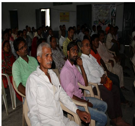
ग्रामीण कार्यशाला में जन-भागीदारी