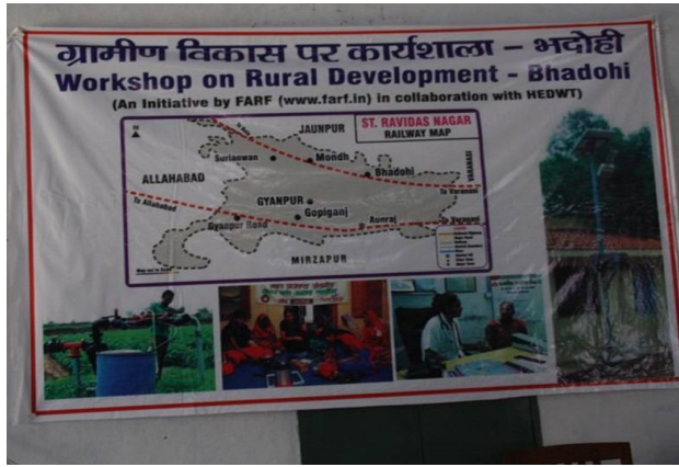
ग्रामीण विकास कार्यशाला में जन-भागीदारी