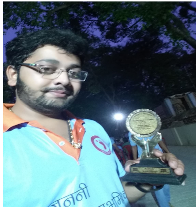
फार्फ़ द्वारा Bhadohi Social Service Awards